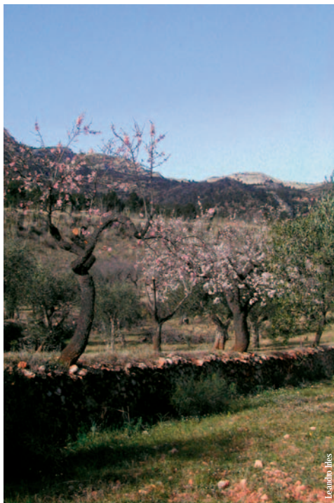
Cultivos y vista del Montcabrer, Muro d'Alcoi

entidad promotora: C. Excursionista de Muro