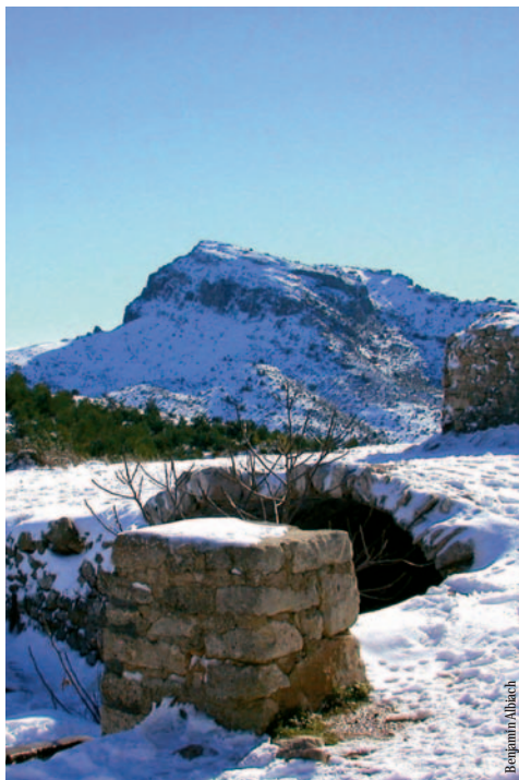
El Montcabrer desde la Cava Arquejada

entidad promotora: C. Excursionista Contestà