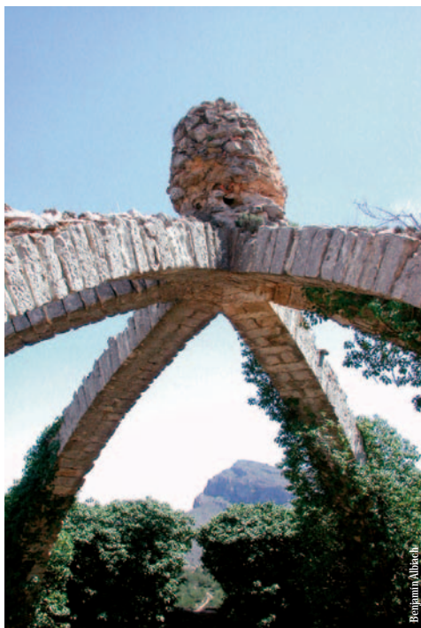
La cava Arquejada, Agres

entidad promotora: Centro Excursionista de Agres