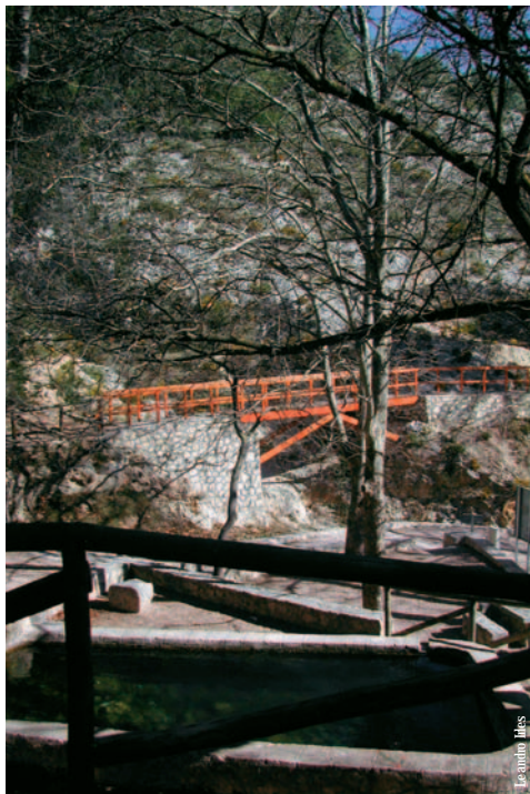
Àrea recreativa de Sant Cristòfol, el Preventori, Alcoi